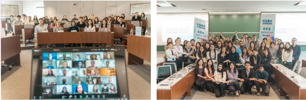
“2025减贫营”开营仪式线上线下载合影

北京时间2025年4月11日，“中拉青年应对全球挑战——2025减贫营”宣讲会与破冰课堂在清华大学顺利举行，通过线上与线下相结合的方式吸引了中拉总计超350名青年参与。来自中拉多所高校与企业的嘉宾代表出席并致辞，表达了对赛事的持续支持与高度期待。