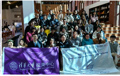
中巴师生参访云南南涧清华乡村书院