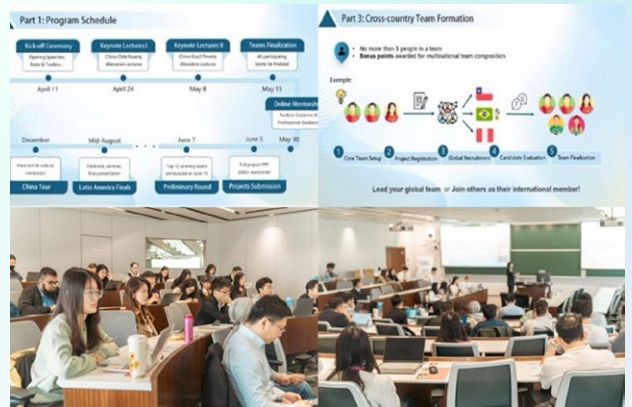
“2025减贫营”赛事介绍环节

在赛事介绍环节，主办方围绕赛程安排、组队机制、评审激励等方面对参赛路径进行了全面说明，对“5W1H+”工具箱进行了详细讲解，提出“发现—理解—分析—应对”四步法，帮助参赛者系统梳理项目设计思路，注重方案设计应关注本土实际与国际可比性，提升落地可行性与逻辑严谨性。