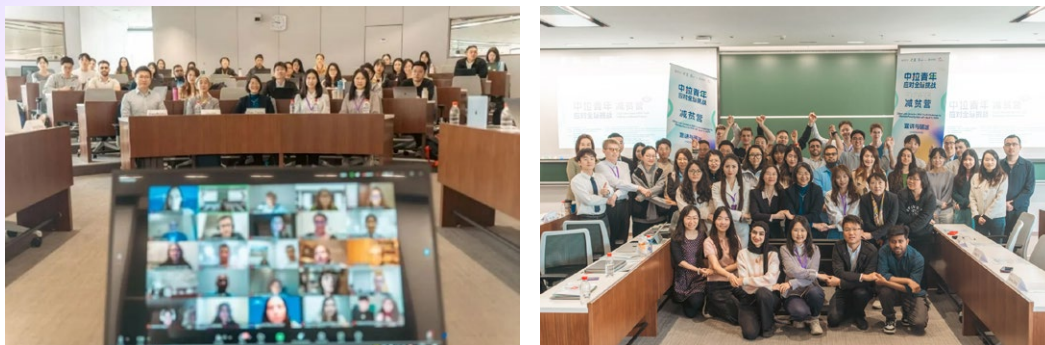
“2025减贫营”开营仪式线上线下载合影

北京时间2025年4月11日，“中拉青年应对全球挑战——2025减贫营”宣讲会与破冰课堂在清华大学顺利举行，通过线上与线下相结合的方式吸引了中拉总计超350名青年参与。来自中拉多所高校与企业的嘉宾代表出席并致辞，表达了对赛事的持续支持与高度期待。