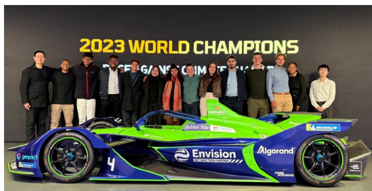
巴西师生参观远景科技集团展厅

三支支队同步开展企业参访交流。巴西支队前往远景科技集团，围绕绿色能源与可持续发展进行交流；秘鲁支队参访五矿有色金属股份有限公司和中国恩菲工程技术有限公司，了解中国企业国际化运作及资源型产业发展经验；智利支队赴国网国际发展有限公司，围绕能源基础设施与公共服务保障等议题进行学习交流。通过企业场景的实地参访，研学团从产业维度加深了对中国发展实践及中拉产业合作路径的理解。