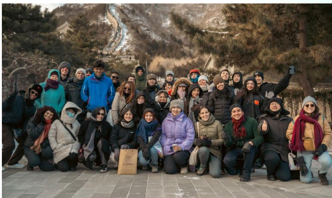
中拉师生走访居庸关长城

2026年1月18日至21日，“2025减贫营”拉美师生在北京开展集中研学与交流。研学团在清华大学举行来华研学破冰见面会，通过面对面交流与互动，增进中拉青年彼此了解，为后续研学活动奠定合作基础。期间，师生还通过文化体验与校园参访，深入感受中国历史文化底蕴与高等院校的学术氛围。