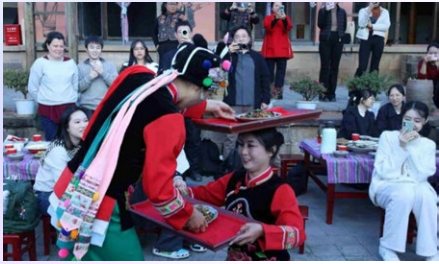
中巴师生在云南南涧观赏跳菜表演