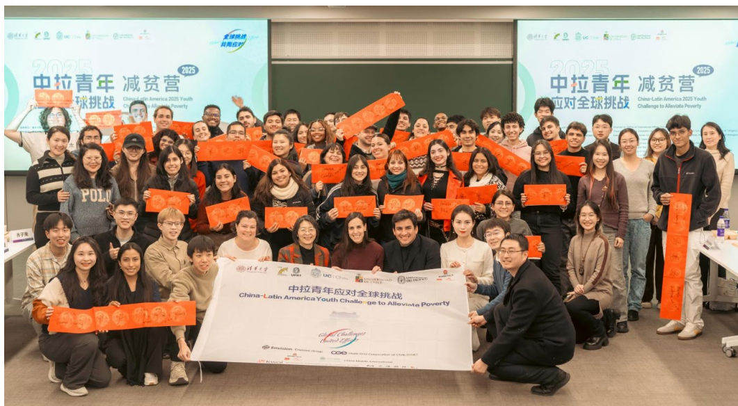
“2025减贫营”拉美青年来华研学破冰会合影

作为“2025减贫营”全流程闭环的重要组成部分，也是落实赛事激励机制中拉美获胜学生来华研学的关键内容，2026年1月18日至24日，“中拉青年应对全球挑战——2025减贫营”拉美师生来华研学活动在中国顺利开展。本次研学行程分为北京集中交流与京外基层实践两个阶段。来自巴西里约热内卢联邦大学、智利天主教大学、智利大学、秘鲁太平洋大学及五矿秘鲁邦巴斯公司的约40名拉美师生，与清华大学师生共同参与为期8天的沉浸式研学交流。本次研学活动由清华大学拉美中心、清华大学学生全球胜任力发展中心、清华大学乡村振兴工作站联合组织。研学期间，师生首先在北京开展专题研讨、机构参访与文化交流，随后分赴云南南涧、湖南慈利、江苏高淳等地开展基层调研，通过实地参访、专题座谈与实践体验相结合的方式，深入了解中国在减贫实践、乡村振兴与可持续发展中的具体做法。