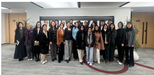
秘鲁师生参访五矿有色金属股份有限公司