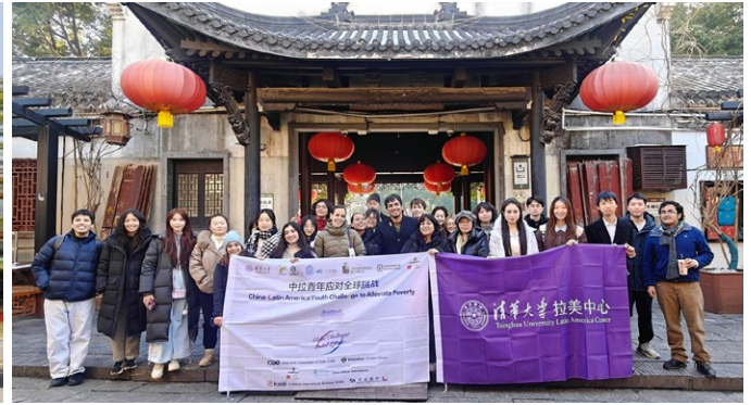
中智师生参访江苏高淳老街

为期8天的来华研学活动，通过北京集中研学与基层实地调研的有机衔接，为拉美青年提供了观察中国减贫与乡村发展的立体化视角。研学活动不仅增强了中拉青年在减贫与可持续发展议题上的相互理解，也进一步夯实了“减贫营”作为长期交流合作平台的基础。通过持续交流与实践积累，中拉青年将为推动全球减贫事业和可持续发展贡献更多青年智慧与行动力量。