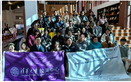
中巴师生参访云南南涧清华乡村书院