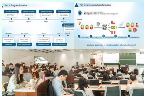
“2025减贫营”赛事介绍环节

在赛事介绍环节，主办方围绕赛程安排、组队机制、评审激励等方面对参赛路径进行了全面说明，对“5W1H+”工具箱进行了详细讲解，提出“发现—理解—分析—应对”四步法，帮助参赛者系统梳理项目设计思路，注重方案设计应关注本土实际与国际可比性，提升落地可行性与逻辑严谨性。