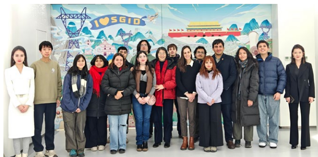
智利师生参访国网国际发展有限公司

2026年1月21日至24日，研学团分为巴西、秘鲁、智利三支平行支队，分别前往云南南涧、湖南慈利和江苏高淳等地开展基层调研。各支队在清华大学拉美中心、清华大学学生全球胜任力发展中心和清华大学乡村振兴工作站的组织协调下，深入乡村一线，系统了解中国在不同区域背景下推进减贫与乡村振兴的多样化实践。