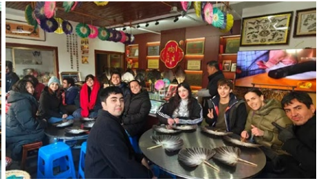
中智师生在江苏高淳学习羽毛扇制作