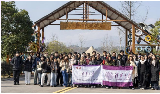
中秘师生参访湖南慈利悬崖花开营地